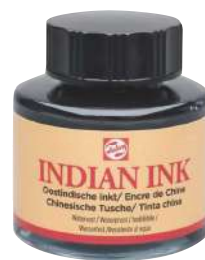
インディアンインク 30mlボトル