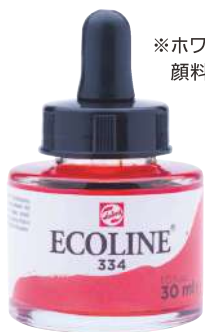
エコライン 30mlボトル 単色