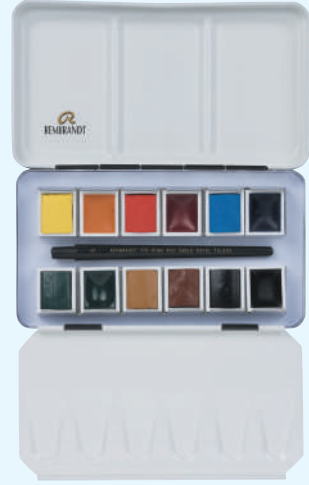
レンブラント固形水彩絵具 モノピグメント12色セット

409458 T0583-8690 72×129×26mm 180g 金属ケース入り ■セット内容 ハーフパン12色、 水彩画用筆 (ビュアレッドセーブル毛丸4号) ■セット配色 (ハーフパン) / 234 248 254 336 377 410 411 503 534 616 681 702 ※混色しても濁りにくい単一顔料で作られた色のみの 12色セット