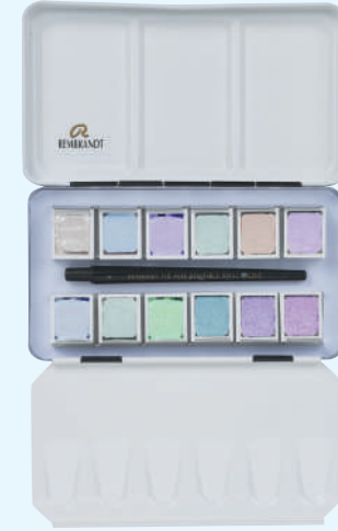
レンブラント固形水彩絵具 スペシャルエフェクト12色セット

409466 T0583-8691 72×129×26mm 180g 金属ケース入り ■セット内容 ハーフパン12色、 水彩画用筆 (ビュアレッドセーブル毛丸4号) ■セット配色 (ハーフパン) / 843 846 847 848 860 861 862 863 864 865 866 867