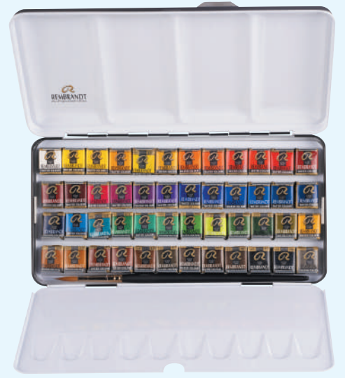
レンブラント固形水彩絵具 48色セット

420630 T0583-8648 118×225×30mm 550g 金属ケース入り ■セット内容 ハーフパン48色、 水彩画用筆 (ビュアレッドセーブル毛丸6号) ■セット配色 (ハーフパン) / 106 207 211 227 234 238 242 246 248 265 305 306 311 318 336 349 354 366 378 403 409 410 411 416 417 503 506 508 511 522 532 534 548 567 576 583 585 615 616 620 623 645 662 668 675 701 708 715