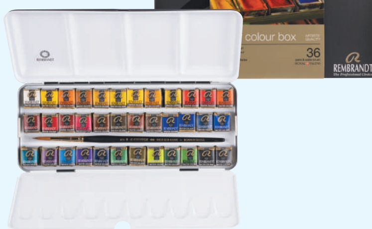
レンブラント固形水彩絵具 36色セット

420621 T0583-8625 74×225×26mm 400g 金属ケース入り ■セット内容 ハーフパン24色、 水彩画用筆 (ビュアレッドセーブル毛丸6号) ■セット配色 (ハーフパン) / 207 211 227 238 246 248 305 306 336 366 409 410 411 416 506 508 511 532 534 616 623 645 662 708