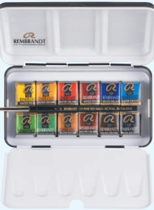
レンブラント固形水彩絵具 12色セット

441645 T0583-8612 72×129×26mm 180g 金属ケース入り ■セット内容 ハーフパン12色、 水彩画用筆 (ビュアレッドセーブル毛丸4号) ■セット配色 (ハーフパン) / 207 227 248 305 336 411 416 506 534 616 662 708