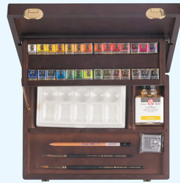
レンブラント固形水彩絵具 マスターBOX42色セット

441653 T0584-0013 215×302×46mm 1840g デラックス木箱入り ■セット内容 固形水彩ハーフパン28色、アラビアガム 75ml、 レンブラントブラシ110#4号、レンブラントブラシ110#8号、 スケッチ鉛筆2B、ネリケシ、陶器パレット ■セット配色 (ハーフパン) / 106 224 238 246 248 254 264 311 325 336 354 366 371 409 411 416 506 508 532 533 535 615 620 623 645 662 701 708