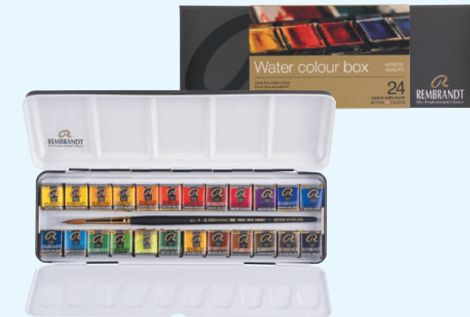
レンブラント固形水彩絵具 24色セット

420621 T0583-8625 74×225×26mm 400g 金属ケース入り ■セット内容 ハーフパン24色、 水彩画用筆 (ビュアレッドセーブル毛丸6号) ■セット配色 (ハーフパン) / 207 211 227 238 246 248 305 306 336 366 409 410 411 416 506 508 511 532 534 616 623 645 662 708