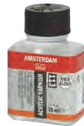
アクリリックバーニッシュ ハイグロス 113 75ml T2428-8113 406874

アクリル樹脂、テレピンと揮発油からなる仕上げ用のつや出しニスです。乾燥したニスは黄変せず、不要になれば、揮発油で取り除くことができます。