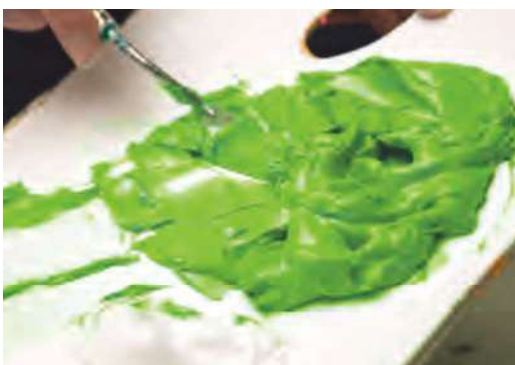
ヘビージェルメディウム グロス