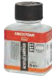
アクリリックバーニッシュ サテン 116 75ml T2428-8116 406904

アクリル樹脂、テレピン、揮発油とつや消し剤からなる仕上げ用のつや消しニスです。乾燥したニスは黄変せず、不要になれば、揮発油で取り除くことができます。