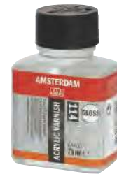
アクリリックバーニッシュ グロス 114 75ml T2428-8114 406882

アクリル樹脂、テレピン、揮発油とつや消し剤からなる仕上げ用の半つやニスです。乾燥したニスは黄変せず、不要になれば、揮発油で取り除くことができます。