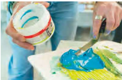
ヘビージェルメディウム マット