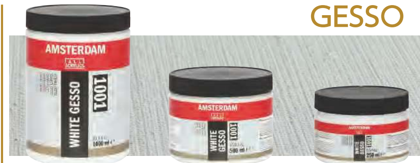
ホワイトジェッソ 1001 1000ml T2419-4001 403670