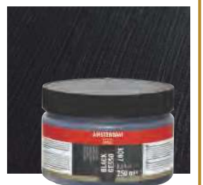
ブラックジェッソ 3007 250ml T2417-3007 403689