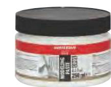
モデリングペースト 1003 250ml T2417-3003 403697