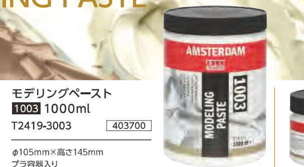
モデリングペースト 1003 1000ml T2419-3003 403700

アクリルエマルジョン、酸化チタンと増粘剤からなる白色の下地剤であり、盛り上げ用の地塗り剤として使えます。乾燥後は硬い塗膜となり、ナイフで削ったり、やすりをかけることもできます。アクリル絵具、油絵具の下地として適しております。