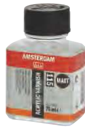
アクリリックバーニッシュ マット 115 75ml T2428-8115 406890